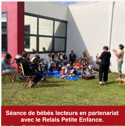
Séance de bébés lecteurs en partenariat avec le Relais Petite Enfance.