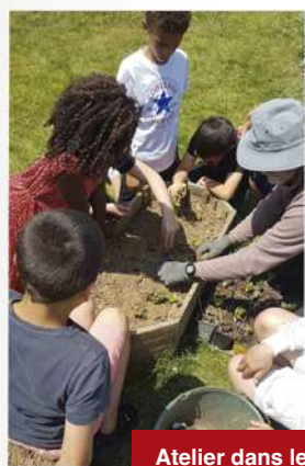
Atelier dans le jardin de la bibliothèque avec les enfants de l'école St Edern