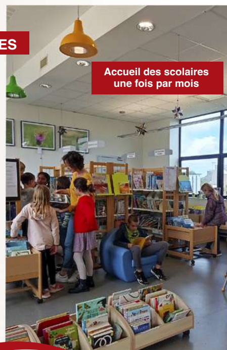
Accueil des scolaires une fois par mois