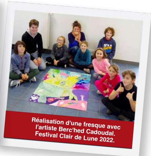
Réalisation d'une fresque avec l'artiste Berc'hed Cadoudal. Festival Clair de Lune 2022.