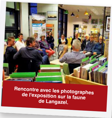
Rencontre avec les photographes de l'exposition sur la faune de Langazel.