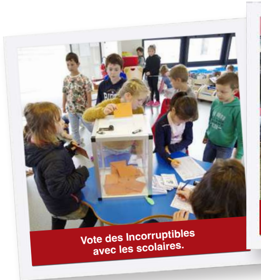
Vote des Incorruptibles avec les scolaires.