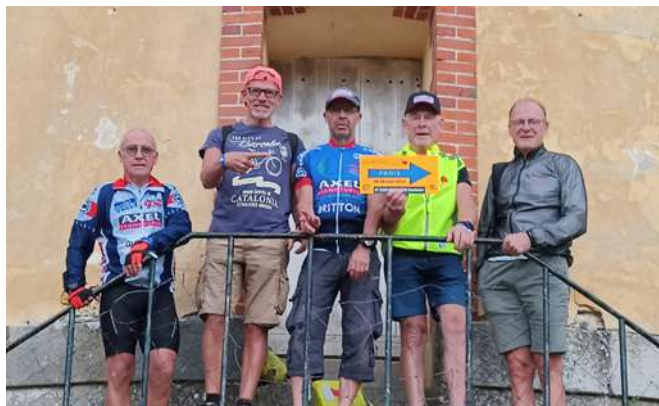
Retrait des dossards.

Retour sur le Paris Brest Paris (PBP) 2023