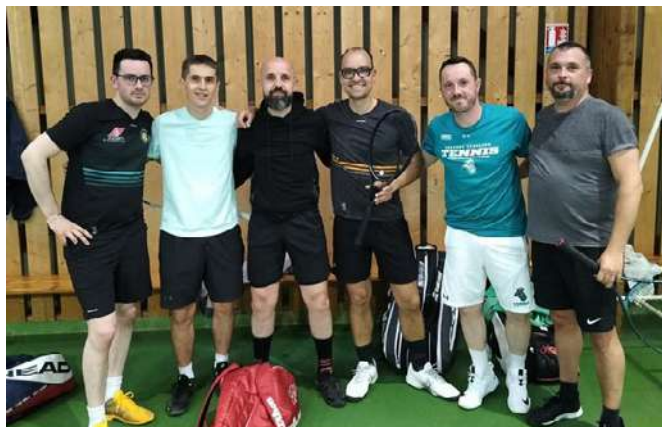
Des joueurs tête de série inscrits au tournoi.

À noter que les portes ouvertes du TCP auront lieu les 1 er et 8 juillet en journée. On vous attend nombreux pour ce moment festif.