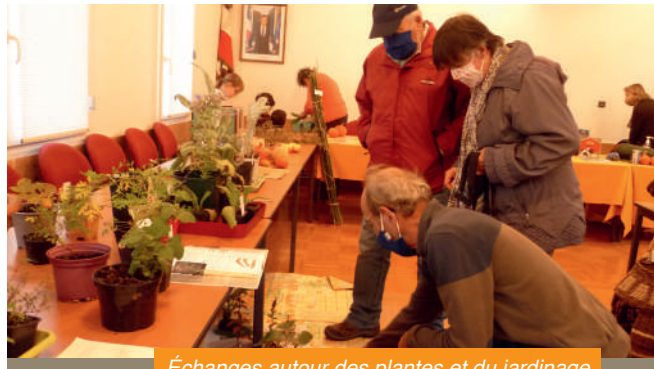
Échanges autour des plantes et du jardinage à la fête de l'automne.

Jardin'Edern a participé à l'organisation de la fête de l'automne du 3 octobre, elle collabore dès à présent avec l'équipe de Ti ar Vugale pour initier les enfants et les habitants au jardin.