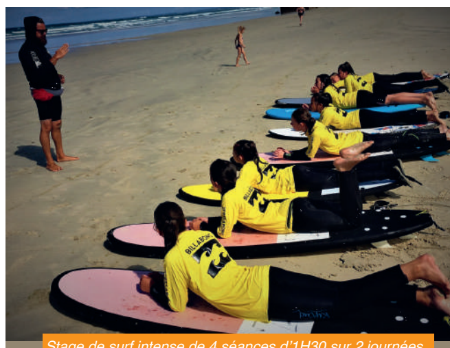
Stage de surf intense de 4 séances d'1H30 sur 2 journées.