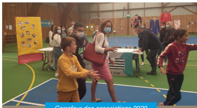
Carrefour des associations 2020.

Le samedi 5 septembre avait lieu le carrefour des associations. Cette année, la covid 19 a bousculé un peu les habitudes.