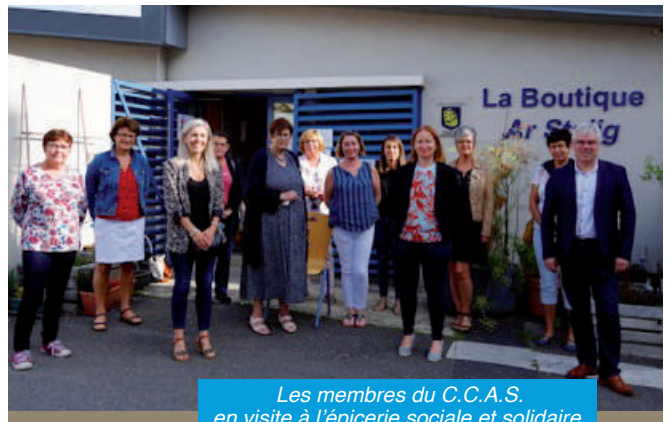
Les membres du C.C.A.S. en visite à l'épicerie sociale et solidaire.

Le 18 septembre dernier, le C.C.A.S de Plouédern a été accueilli par l'épicerie sociale et solidaire de Landerneau pour visiter leurs locaux et reverser l'intégralité des dons faits par les habitants de la commune lors de la distribution des masques au printemps dernier.