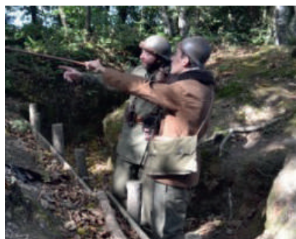
Reconstitution : Deux soldats français à la campagne de 1940.