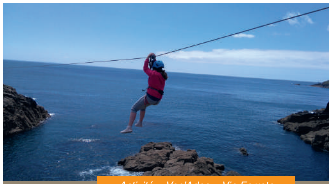
Activité « Vac'Ados » Via Ferrata au fort de Bertheaume à Plougonvelin.

Nous avons également choisi les prestataires avec lesquels nous avons l'habitude de collaborer afin de garantir un déroulé d'activité sécurisé.