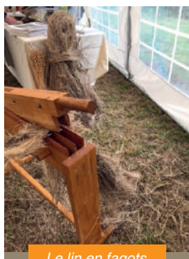
Le lin en fagots.

Le souvenir de la culture était encore bien présent. Emile avait arraché le lin et l'avait lié en fagots à l'âge de 13-14 ans, d'autres se souvenaient du transport de la récolte en charrette à cheval... La surprise a été plus grande devant les planches de surf, les raquettes de tennis, ou le filament pour imprimante 3D produits à partir de fibres de lin ou devant les qualités exceptionnelles du béton de chanvre utilisé pour l'isolation des bâtiments.