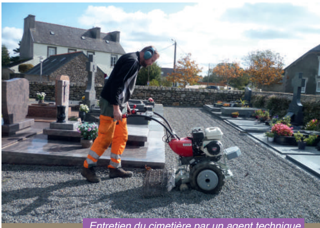
Entretien du cimetière par un agent technique.

La commune a fait l'acquisition d'un motoculteur de désherbage qui élimine les mauvaises herbes, aère et nivelle le sol. Les pierres tombales et les espaces inter-tombes sont à nettoyer par vos soins. Il faut les laver, les dégraisser, voire les traiter. La mousse et les lichens sont les principaux ennemis de la pierre naturelle. N'oubliez pas de nettoyer également autour de la sépulture car le motoculteur ne peut pas passer entre les tombes. Les racines des plantes peuvent, en effet, dégrader les monuments. Privilégiez les produits écologiques, afin de préserver l'environnement.