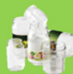
Pots et bocaux en verre sans le couvercle