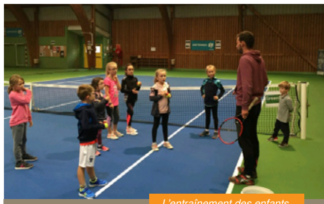
L'entraînement des enfants.

La reprise au TC PLOUEDERN se fera courant septembre lors du carrefour des associations (inscriptions) et présentation du club de tennis aux visiteurs. La reprise officielle des championnats par équipe devrait se dérouler début octobre. Fort de ses 2 courts en résine spécifique tennis « green set », le club est à taille humaine et la convivialité est au rendez-vous. Détente, loisirs et compétitions sont les ADN du club. Les licenciés trouveront une offre complète (tennis loisir, tennis entraînement et compétition) pour la saison prochaine. Les 2 entraîneurs diplômés d'Etat, salariés du club, sont le gage d'un enseignement de qualité pour les jeunes comme pour les adultes. Nous vous attendons !