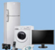
Ecrans et électroménager