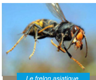
Le frelon asiatique

Important : l'entreprise ne détruit que les nids, inutile d'appeler si le nid n'est pas localisé.