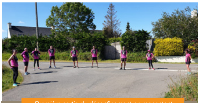
Première sortie du déconfinement en respectant les consignes sanitaires imposées