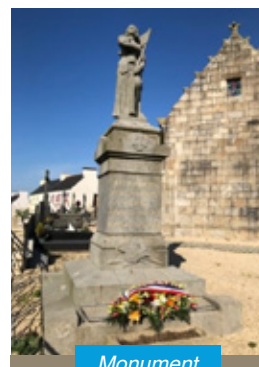
Monument aux morts.

La cérémonie patriotique du 8 mai s'est déroulée dans le respect des consignes de sécurité sanitaire. La présence de 5 personnes maximum était requise. M. Le Maire et un adjoint ainsi que 3 membres de l'UNC (Union Nationale des Combattants) y ont participé. La cérémonie a consisté à déposer une gerbe au Monument aux Morts.