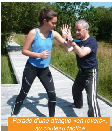
Parade d'une attaque « en revers », au couteau factice

Pour ce qui concerne la compétition-combat au couteau factice, il s'agira tout d'abord d'apprendre à bien gérer son stress face à une agression à risque légal, afin de pouvoir mettre en place une action « efficace ».