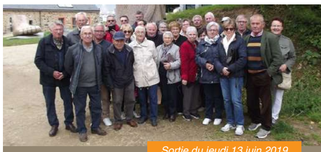
Sortie du jeudi 13 juin 2019

L'Assemblée Générale aura lieu le samedi 16 novembre 2019.