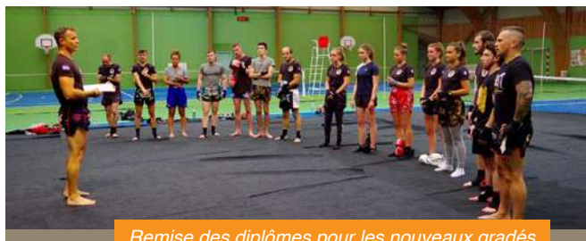
Remise des diplômes pour les nouveaux gradés

De plus, une dizaine de boxeurs aura réussi son passage de grade (dit « prajeet » en muay thaï), ce qui confirme l'évolution technique de chacun et l'apprentissage de cette discipline très complète et particulièrement efficace, dans laquelle les notions de prise de confiance en soi et de gestion de ses émotions ne sont plus à démontrer.