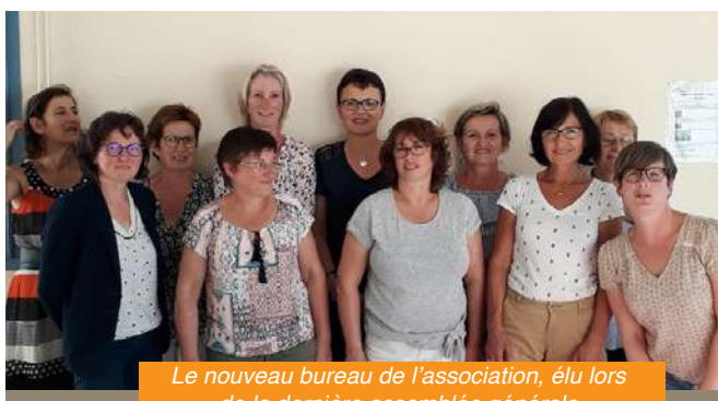
Le nouveau bureau de l'association, élu lors de la dernière assemblée générale

N'hésitez pas à venir nous rencontrer le samedi 7 septembre au forum des associations, salle Steredenn, pour demander plus de renseignements ou vous inscrire !