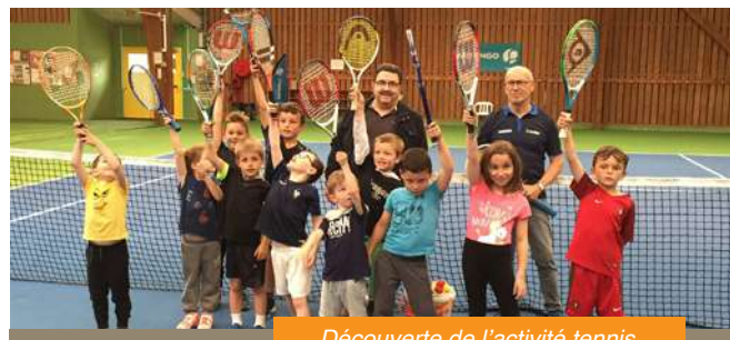
Découverte de l'activité tennis

Lors des séances de découverte, les 8 et 15 juin derniers, une vingtaine d'enfants se sont rendus à la salle de sports. L'encadrement était assuré par des bénévoles. Les enfants qui découvrent le tennis pour la première fois étaient ravis d'avoir entre les mains une raquette. À l'issue de cette journée, il a été remis aux enfants une boîte de balles. Pour l'année prochaine, un nouvel entraîneur pour les jeunes sera d'une aide précieuse à Christophe Queau, BE du club.