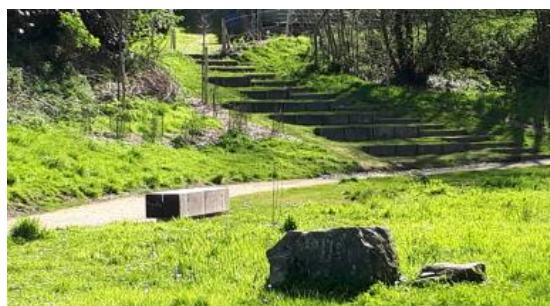
Les gradins en plein air