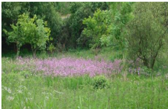
Une flore caractéristique des zones

Le Vallon de Milin Névez regroupe deux prairies en zone humide en plein cœur du bourg de la commune de Plouédern : la prairie du Cann et la prairie de la fontaine.