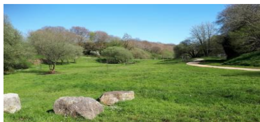
Des espaces de promenade

La Prairie de la Fontaine est la moins humide des deux. Le ruisseau du Forestic la traverse également, les espaces sont plus grands et la commune a également réalisé un aménagement de gradins propices aux animations en plein air