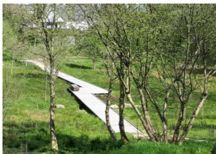
Le platelage au-dessus de la prairie humide

La Prairie du Cann est une ancienne carrière abandonnée depuis de nombreuses années qui a été aménagée en 2017 avec des chemins piétonniers et quelques panneaux pédagogiques pour expliquer ce site naturel à préserver. Elle est traversée par le ruisseau du Forestic au-dessus duquel la commune a réalisé l'aménagement d'un platelage. On y retrouve plusieurs espèces végétales et animales typiques des zones humides Finistériennes.